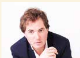
Mauro Borgioni - baritono

Un gentiluomo una sera, costretto ad una sosta, chiede ospitalità in un castello. Il padrone lo riceve convenientemente. Al momento della cena, nella grande sala appare da dietro le tende una donna vestita di nero con la testa completamente rasata che va a sedersi in fondo alla tavola per mangiare in silenzio. Le viene servito da bere in una coppa ricavata da un cranio umano le cui orbite sono state sigillate con l'argento.