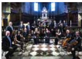
Orchestra da camera di Perugia