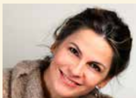
Astra Lanz - attrice